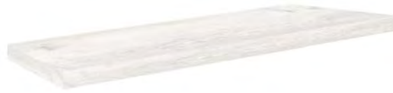
4820 - Angolo Gradone/Corner Step DX 20x120 / 8"x48" ▲ 194