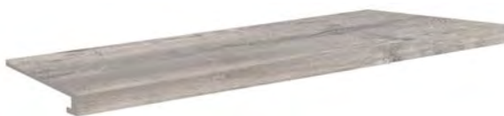
4822 - Gradone/Step Tread 20x120 / 8"x48" ▲ 192