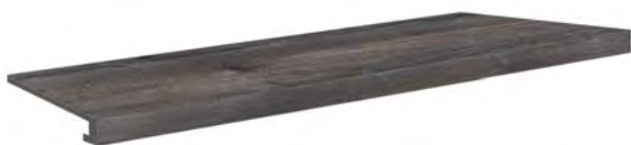
4825 - Gradone/Step Tread 20x120 / 8"x48" ▲ 192