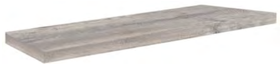
4823 - Angolo Gradone/Corner Step DX 20x120 / 8"x48" ▲ 194