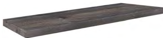
4826 - Angolo Gradone/Corner Step DX 20x120 / 8"x48" ▲ 194