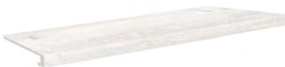
4819 - Gradone/Step Tread 20x120 / 8"x48" ▲ 192