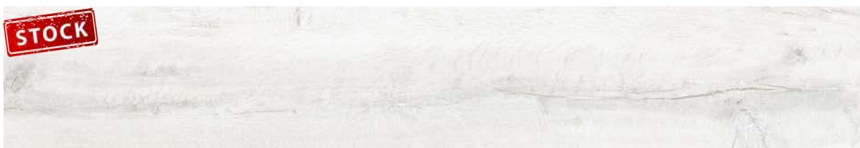
4645 - 20X120 / 8"x48" ■ 165